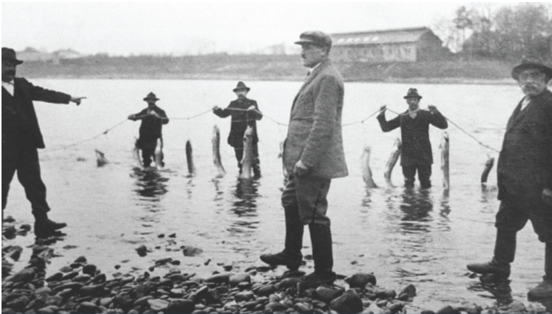
Fig. 2: Autrefois, les saumons capturés dans le Rhin étaient parfois si nombreux qu'ils étaient attachés vivants dans le courant pour être maintenus au frais. Les poissons attachés servaient également d'appâts vivants pour attirer d'autres saumons. La photo montre des pêcheurs utilisant cette méthode dans le Rhin à Grenzach en 1927.

Le saumon est déjà réapparu dans la Sieg, un affluent du Rhin qui s'écoule en Rhénanie du Nord – Westphalie, où il se reproduit avec succès. Il est donc permis d'espérer un retour en Suisse. Ces dernières années, trois saumons ont été capturés dans les eaux helvètes : le premier a été pêché en 2008 en pleine ville de Bâle, le troisième, et jusqu'à présent le dernier, a été découvert en mai 2012 dans le bassin de comptage du barrage de Rheinfelden. Les analyses génétiques ont confirmé qu'il s'agissait bien d'un saumon atlantique. Il pesait 6 kg et se montrait visiblement affaibli par sa longue migration ; 880 km séparent en effet Rheinfelden de la mer. Etant donné que plusieurs grands barrages du Rhin supérieur ne disposent toujours pas de passes à poissons, les courageux migrateurs ont certainement dû emprunter les écluses pour parvenir jusqu'en Suisse.