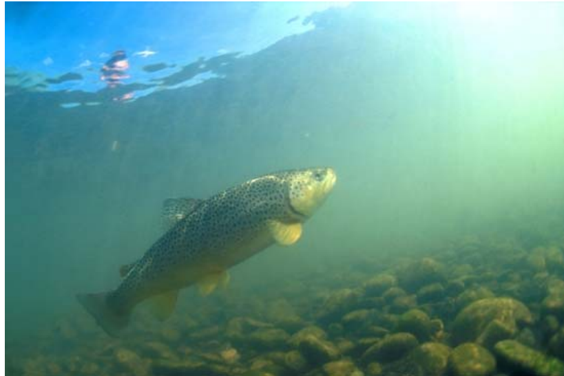
Abbildung 1: Verschwindet die Bachforelle 2050 aus dem Mittelland?

Der Klimawandel ist eine der grössten Herausforderungen unserer Zeit. In den vergangenen hundert Jahren hat sich die Erde laut IPCC (Intergovernmental Panel on Climate Change) bereits um durchschnittlich 0.74 °C erwärmt. Klimatische Modelle prognostizieren je nach Region eine weitere Erwärmung von 1.2 °C bis 6.4 °C bis 2100. Dies hat für viele Organismen drastische Folgen. Die Temperatur ist für sie einer der wichtigsten Umweltfaktoren, denn sie steuert viele lebensnotwendige Prozesse. Besonders betroffen sind wechselwarme Lebewesen wie Fische, die ihre Körpertemperatur nicht selbst regulieren können, sondern stetig ihrer Umgebung anpassen. Prozesse wie Reproduktion, Wachstum, Entwicklung und Wanderung sind stark von der Temperatur abhängig. Klimaveränderungen können daher zu einer anderen Artenverteilung entlang der Flussläufe führen.