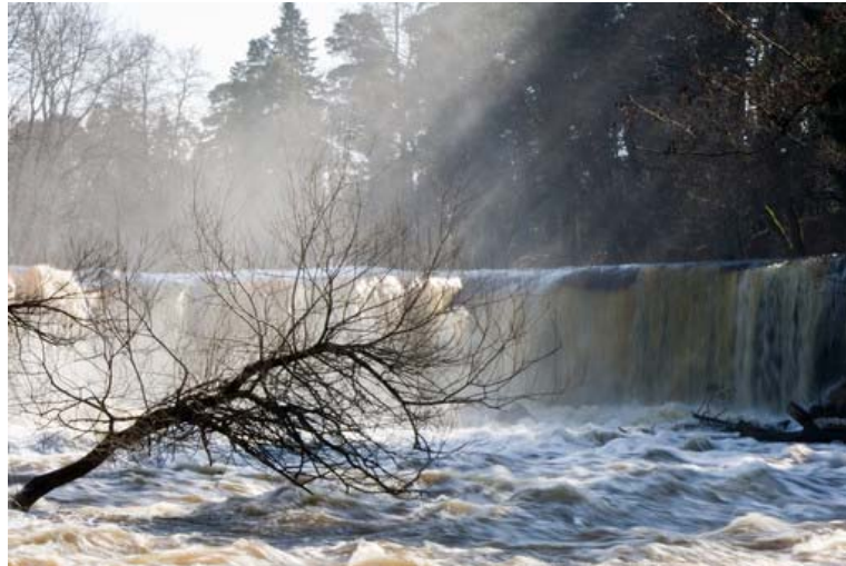
Abbildung 3: Künstliche Schwellen verhindern, dass Fische vor ansteigenden Temperaturen flussaufwärts fliehen können.

Das BAFU schätzt anhand eines Modells, dass sich der für Bachforellen optimale Raum in der Schweiz bis zum Jahr 2050 mindestens um 6% der heutigen Fläche verringert; die Flächenabnahme kann jedoch bis zu 44% betragen (Abbildung 2) [3]. Letzteres Szenario würde das Aus für die Bachforelle im Mittelland bedeuten. Auch die Äsche wird durch eine Erwärmung hart getroffen. Sie braucht Gewässer von einer bestimmten Breite, ihre Populationen liegen oft unterhalb von Seen. Das macht ihr eine Flucht nach oben unmöglich, weil die Flüsse tendenziell enger werden und den Habitatsansprüchen der Äsche nicht mehr entsprechen. Die sowieso schon stark bedrohte Art könnte in manchen Flüssen vollends verschwinden. Auch die Wandermöglichkeiten der anderen Fische sind begrenzt, denn die meisten europäischen Flüsse sind durch Dämme, Wasserkraftwerke und andere Hindernisse stark fragmentiert (Abbildung 3). Die vorausgesagte Verschiebung von Fischgemeinschaften in höhere Lagen ist also in den meisten Fällen gar nicht möglich, sodass höhere Wassertemperaturen das lokale Aussterben mancher Arten zur Folge haben würden.