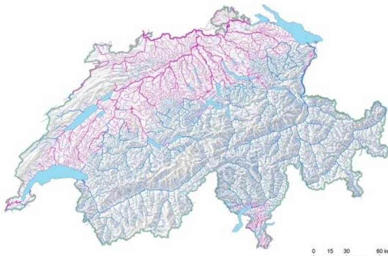
Abbildung 2: Mögliche Verbreitung der Bachforelle in der Schweiz im Jahr 2050 nach einem Modell

In bergigen Gebieten wie der Schweiz führt diese Temperaturabhängigkeit von Lebensprozessen zu einer deutlichen Längsverteilung der Fischgemeinschaften von der Quelle bis zur Mündung. Man spricht von der Forellen-, Äschen-, Barben- und Brachmenregion. Diese Einteilung ergibt sich durch die stetige Zunahme der Wassertemperatur und der Abnahme des Gefälles eines Flusses von der Quelle bis zur Mündung. So ist die Verbreitung der Kaltwasserfische (Salmoniden/Lachsfische) in der Regel auf die Oberläufe, die der Warmwasserfische (Cypriniden/Karpfenfische) auf die Unterläufe beschränkt. Am Beispiel eines österreichischen alpinen Gewässers - der Murg - wurde ein mögliches Szenario für eine Wassertemperaturerhöhung von ca. 1 °C entwickelt [1]. In diesem Modell werden die Salmonidenregionen durch die erhöhten Temperaturen bis zu 27 km in Richtung Quelle verschoben. Der Lebensraum für Warmwasserfische wie Barben und Brachmen wird dadurch verlängert. Dies hängt mit der relativ engen Temperaturtoleranz von Salmoniden zusammen. Bei Bachforellen zum Beispiel macht der Unterschied zwischen bevorzugter und tödlicher Temperatur nur ein paar Grad aus [2]. Die Bachforellen werden also versuchen, durch Wanderung in höhere Lagen kritische Temperaturen zu vermeiden, sofern die flussaufwärts gelegenen Gewässerabschnitte zugänglich sind und eine geeignete Struktur aufweisen.